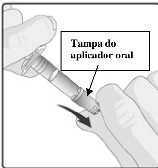
1. Remover a tampa protetora do aplicador oral.

Instruções para administração da vacina com o aplicador oral: