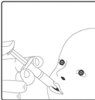
2. Esta vacina destina-se apenas à administração oral . A criança deve estar sentada em posição reclinada. Administrar por via oral (isto é, na boca da criança, na parte interna da bochecha) todo o conteúdo do aplicador oral .